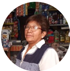
La Señora Irvana