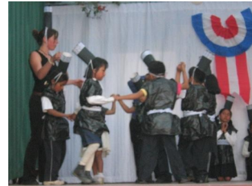
Cuna Lara y Colegio Galo Peruano

Esta revista permite demostrar el vínculo que existe entre nuestros dos países, Perú y Francia. La danza y la música también nos une ya que los niños de 1er y 5to grado de primaria aprendieron danzas tradicionales de Francia y demostraron sus habilidades artísticas en esta fecha..